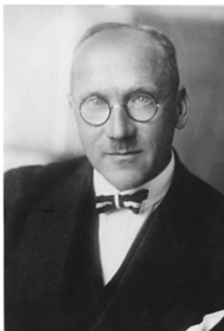
تصویر ۱- فردیناند زاوئر بروخ

ارنست فردیناند زاوئر بروخ (3 ژوئیه 1875 - 2 ژوئیه 1951 میلادی) یک جراح آلمانی چیره‌دست بود که همواره ابهاماتی درباره ارتباط وی با حزب نازی وجود داشت. ذبیح‌الله منصوری، اقتباسی آزاد از سرگذشت وی را به زبان فارسی منتشر کرده است (تصویر 1).